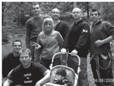
Ausflug zum Hochseilgarten nach Oberviechtach

Nach den vielen Trainingseinheiten und den Wettkämpfen zeigten sich auch die Kickboxer in Oberviechtach am Hochseilgarten von ihrer besten Seite. Keinem der Teilnehmer waren die Übungen zu schwer oder die Seile zu hoch gespannt. Mit Freude über das gelungene Event kehrten die Sportler nach fast vier Stunden wieder zurück.