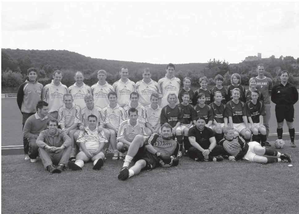
Gruppenfoto mit Schiedsrichter des Fußballspiels.

Spaß und soziales Engagement verknüpften die Fußballer der 1. Mannschaft des ATSV Kallmünz. Bei einem Benefiz-Fußballspiel gegen ihre Frauen und Freundinnen kamen 300.- € zusammen, die jetzt dem VKKK (Verein zur Förderung krebskranker und körperbehinderter Kinder Ostbayern) gespendet wurden.