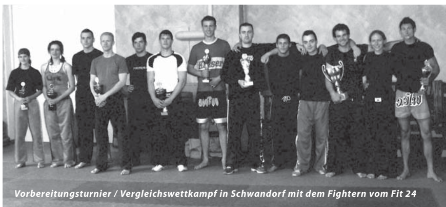
Vorbereitungsturnier / Vergleichswettkampf in Schwandorf mit dem Fightern vom Fit 24