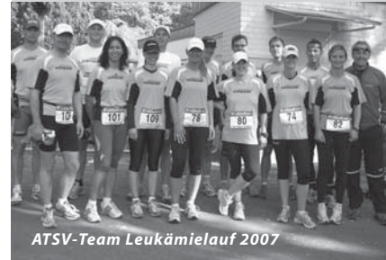
ATSV-Team Leukämielauf 2007

Mit 50 aktiven Läufern ist der ATSV Kallmünz beim Regensburger Leukämielauf am 7. Oktober vertreten gewesen. Die ATSV-Gruppe war deutlich zu erkennen, denn die Firma Hofmann Personalleasing Regensburg hatte für dieses Ereignis jeden Läufer mit einem funktionellem Laufshirt ausgestattet.